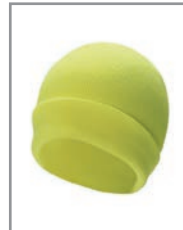
KXASHG Gelb 19 x 20 cm

Sport, Events, Industrie, Security, Radfahren, Joggen, Wandern, Schulweg