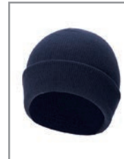
KXASHN Navy 19 x 20 cm