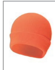
KXASHO Orange 19 x 20 cm