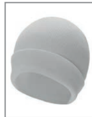
KXASHW Weiß 19 x 20 cm