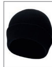
KXASHS Schwarz 19 x 20 cm