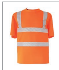
KXVRO Orange S - 5XL